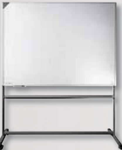
Inkl. Rollstativ Eloxiertes Aluminium