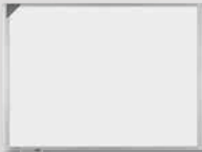
Wandmontage Eloxiertes Aluminium

Das interaktive eBoard kann auf drei verschiedene Arten platziert werden