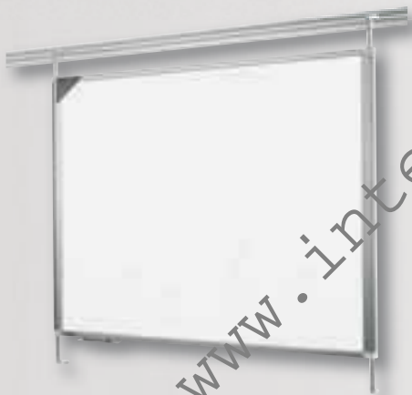
Inkl. Tragarmset für Legaline DYNAMIC Eloxiertes Aluminium